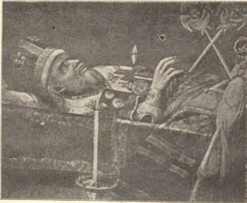
Платонъ, митрополитъ московскій, въ гробу.

По отпѣваніи, кипарисовый гробъ съ тѣломъ почившаго святителя съ печальной процессіей несомъ былъ священнослужителями въ Спасо-Виѣанскій монастырь, — мѣсто вѣчнаго упокоенія святителя, — при уныломъ пере-