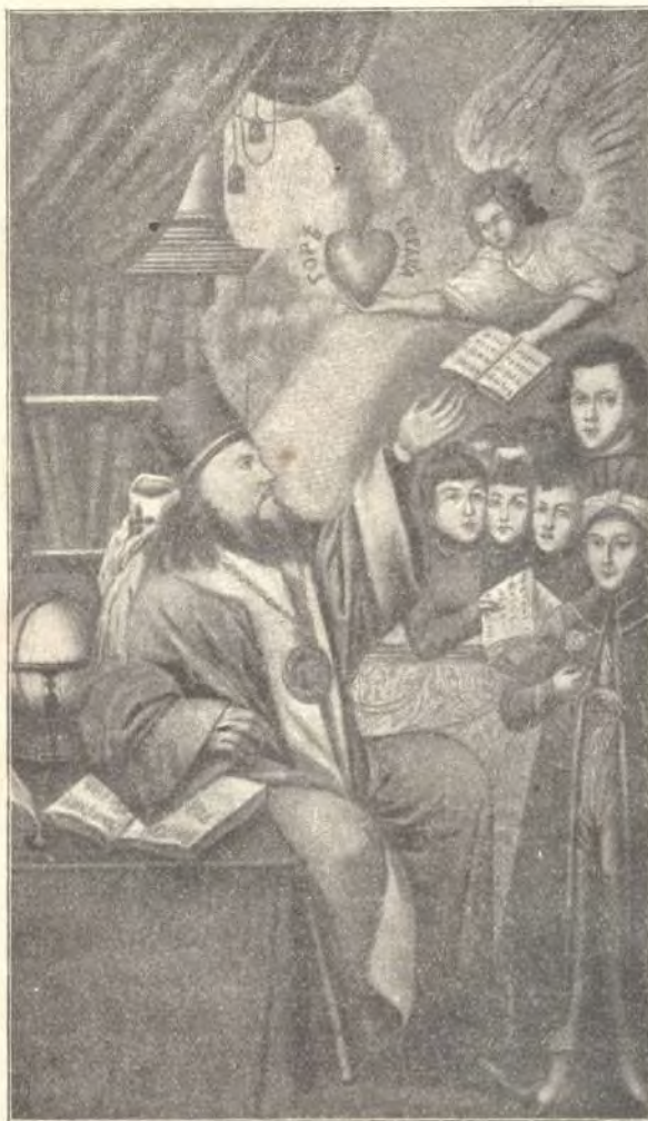
Митрополитъ Платонъ съ учениками.

„Все убранство этихъ уютныхъ келій, гдѣ жилъ и скончался великій іерархъ русской Церкви, носитъ слѣды его ума и вкуса, напоминая въ то же время и славный вѣкъ, которому принадлежала его дѣятельность. Осматривая эти покои и проникнувшись отъ нихъ воспоминаніями о незабвенномъ Платонѣ,